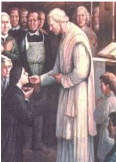
Marsyllis: origen de la Congregación Hijas de la Cruz